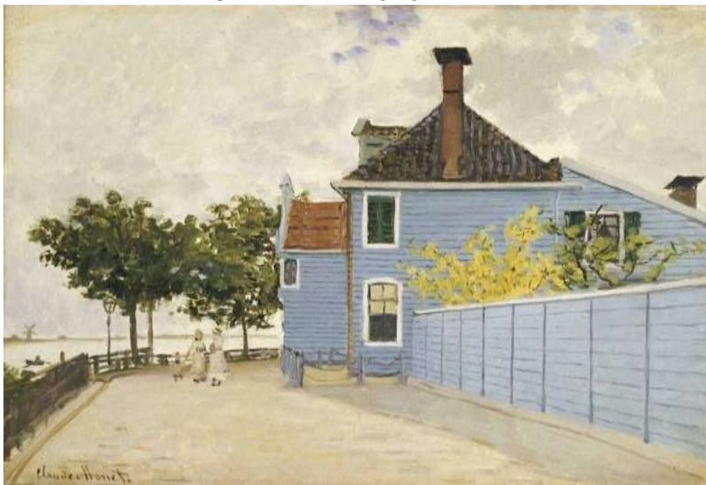
Het Blauwe Huis van Monet (olieverf op doek, 46 * 61 cm)

In 1871 werd het huis door Claude Monet op het witte doek vastgelegd.