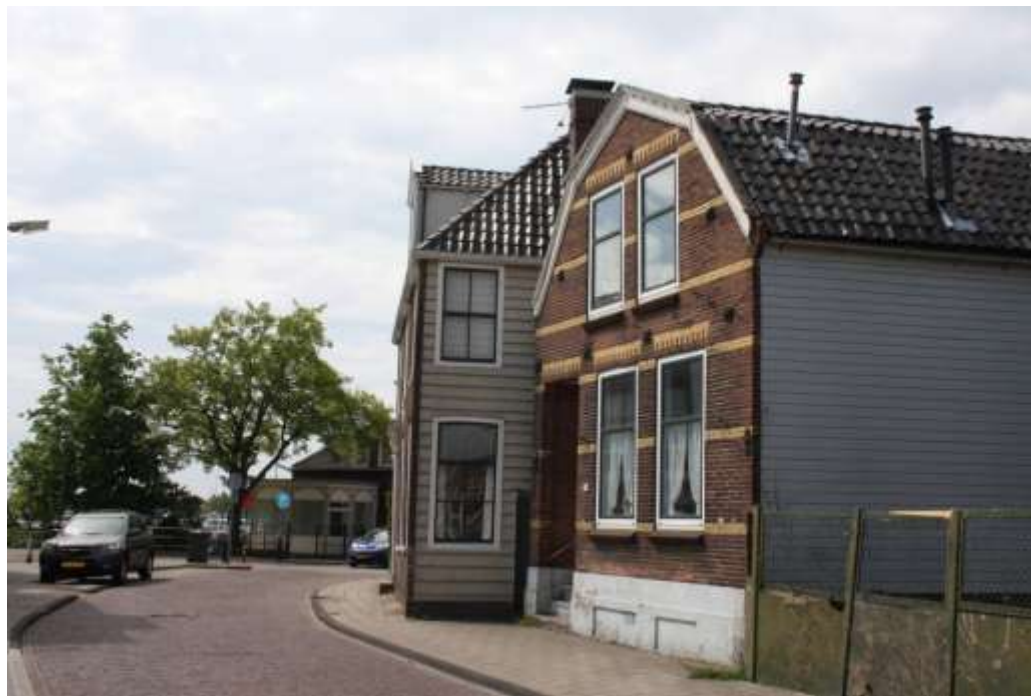
het huis in het midden is het Blauwe Huis