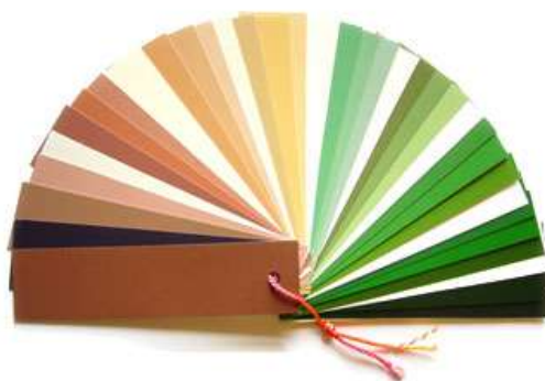
Zaanse kleurenwaaier (Rob van Maanen, www.kleurbureau.nl )

Begin 2011 werd de Zaanse kleurenwaaier gepresenteerd. Dat leverde naast verschillende tinten groen ook een verrassend palet aan andere kleuren, waaronder blauw-groenige tinten. Maar niet zo’n helder blauwe kleur als op het Blauwe Huis. Hiermee werd de vraag naar een gedegen veronderzoek naar de planken op het Blauwe Huis nog interessanter. Had Monet een ruimte artistieke vrijheid genomen met betrekking tot de kleur?