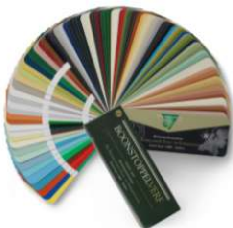
Boonstoppel monumenten kleurenwaaier 2013

"De Boonstoppel Nederlandse Stad- en Streekwaaier is ook ontwikkeld door het Kleurbureau van Rob van Maanen dat op basis van 25 jaar onderzoek naar kleur in Nederland advies uitbrengt aan Gemeenten, Welstand, Monumentenzorg, stedenbouwkundigen en architecten op het brede terrein van kleur in de gebouwde omgeving, en met dank aan Piet Kempenaar van Verfmolen De Kat, pigmentexpert Sjors van Leeuwen en architect/stedenbouwkundige Sjoerd Soeters voor hun adviezen."