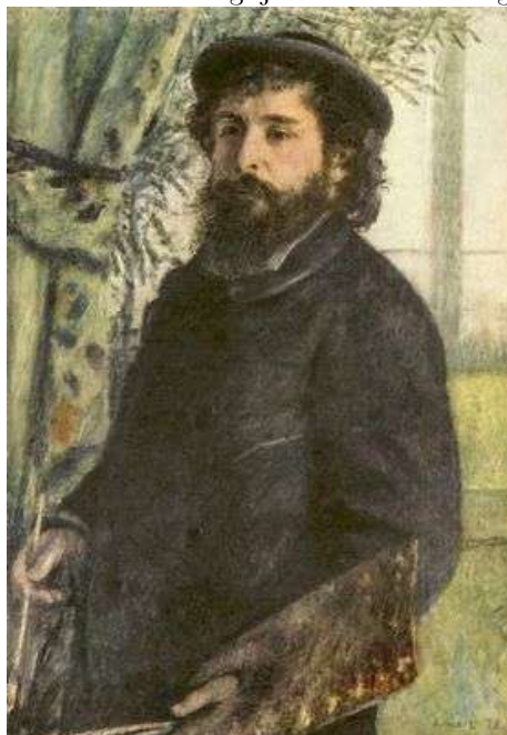
Claude Monet door Pierre-Auguste Renoir, 1875 (olieverf op doek, 84 * 60.5 cm, Musée d'Orsay, Parijs)

Monet wordt gezien als de grondlegger van een van de belangrijkste kunststromingen van de 19 de eeuw, het Impressionisme.